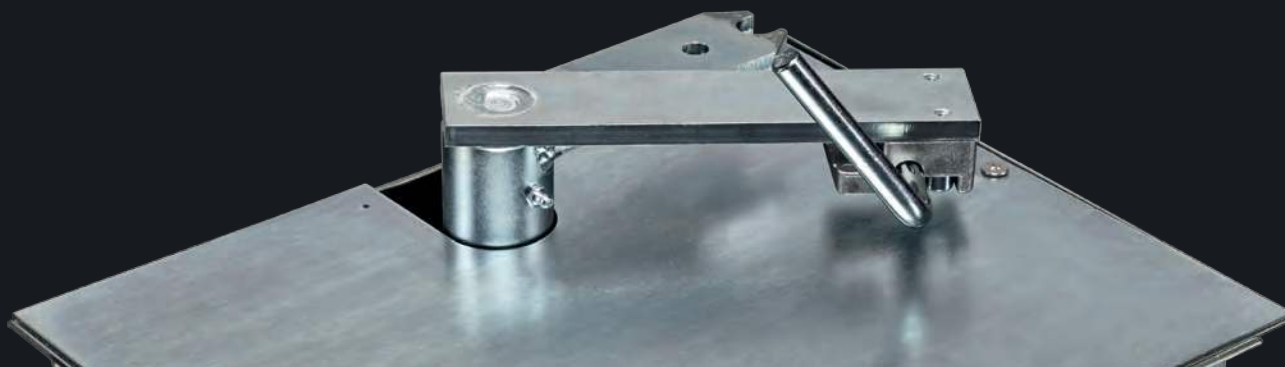
LEVA SBLOCCO MANUALE DI FACILE UTILIZZO