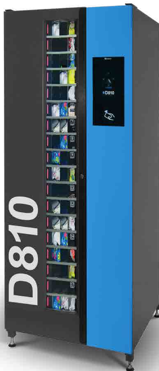
De machine is verkrijgbaar met of zonder gebruikerspaneel

De indrukwekkende laadcapaciteit van het apparaat wordt bereikt dankzij de functie van het aanpassen van de kamers in breedte en hoogte, in 9 configuraties. Planken kunnen verschillende maten hebben. Door een eenvoudige wijziging van instellingen kunt u de capaciteit van de machine telkens aanpassen aan de huidige operationele behoeften.